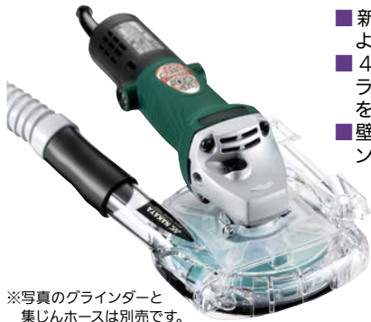
※写真のグラインダーと集じんホースは別売です。